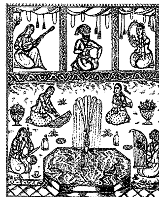
تصویر ۹ - نسخه هزارو یکشب، ۱۲۷۲ هـ. ق، تهران، چاپ سنگی

در ترکیب‌بندی مجالس به انرژی بصری عناصر کمتر توجه شده است. به همین دلیل، هر جای فضای تصویر که خالی مانده با