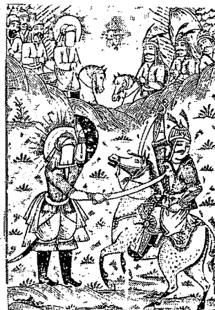
تصویر ۴- نسخه افتخار نامه حیدری، ۱۳۱۰ هـ.ق چاپ سنگی

۱- آثار مربوط به شخصیت و داستان‌های پیرامون زندگی پیامبر اکرم و اهل بیت علیه‌السلام مانند: حمله حیدری که اولین نسخه مصور آن در سال ۱۲۶۴ هـ.ق منتشر شد و اسرار الشهدا که اولین نسخه مصور آن به سال ۱۲۶۸ هـ.ق چاپ شد و طوفان البکاء که اولین نسخه مصور آن به سال ۱۲۷۲ هـ.ق منتشر شد. اکثر تصویرسازی‌های این نسخه‌ها اثر میرزا علیقلی خوئی از بهترین نقاشان چاپ سنگی این دوره است. از نمونه‌های بارز این آثار می‌توان کتاب افتخار نامه حیدری را نام برد. متن این کتاب در ستایش حضرت امیرالمؤمنین علی (ع) و شرح حالات و فتوحات ایشان است که در دوره ناصری - به شیوه رزم خوانی و حماسی - سروده شده است. این کتاب دو جلد است و به تاریخ ۱۳۱۰ هـ.ق.