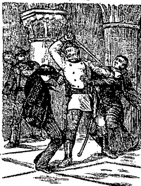
مُعَلِّمِ بِنَدْرَهْمَت تصویر ۷- نسخه کنت مونت کریستو، ۱۳۲۲ هـ. ق، تهران، چاپ سنگی

معمولاً تصویرسازی این نوع کتاب ها، به صورت کپی برداری از تصاویر نسخه اصلی صورت