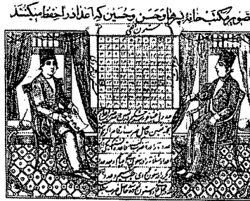
تصویر ۸ - نسخه الف و بای مفتاح الملک، ۱۳۰۳ هـ. ق، تهران، چاپ سنگی

پرهیز از عمق‌نمایی طبیعت‌گرایانه در تصاویر کتب چاپ سنگی، وفاداری به ارزش‌های تصویری و تجسمی سنت‌های هنر تصویری ایران را در آنها نشان می‌دهد. قرارگیری هر پیکره در مقابل پیکره‌ای دیگر، به طوری که قسمتی از پیکره زیرین را می‌پوشاند، حس پلان‌بندی و جلو و عقب بودن را منتقل