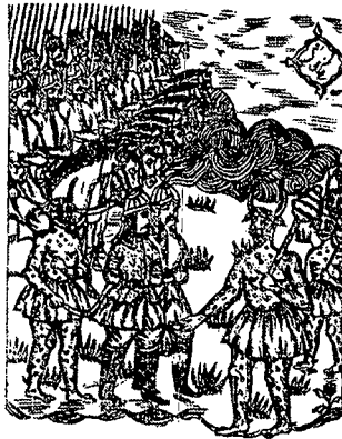
تصویر ۶- نسخه امیرارسلان، ۱۳۱۷ هـ. ق، تهران، چاپ سنگی

و تصویرگر با تکرار خطوط و پیکره های سوار بر اسب بر تحرک و پویایی تصاویر کمک کرده است (تصویر ۶).