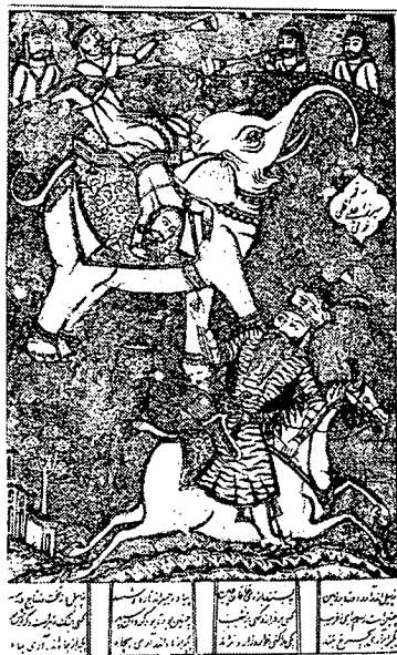
تصویر ۱- نسخه شاهنامه فردوسی، ۱۲۶۵ هـ.ق، تهران