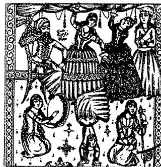
تصویر ۵- نسخه هزارویکشب، ۱۲۷۲ هـ. ق، چاپ سنگی